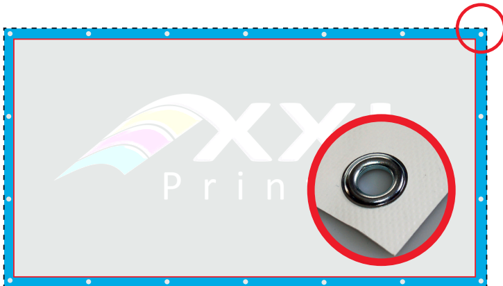
Ausführung mit umlaufendem Saum und Ösen