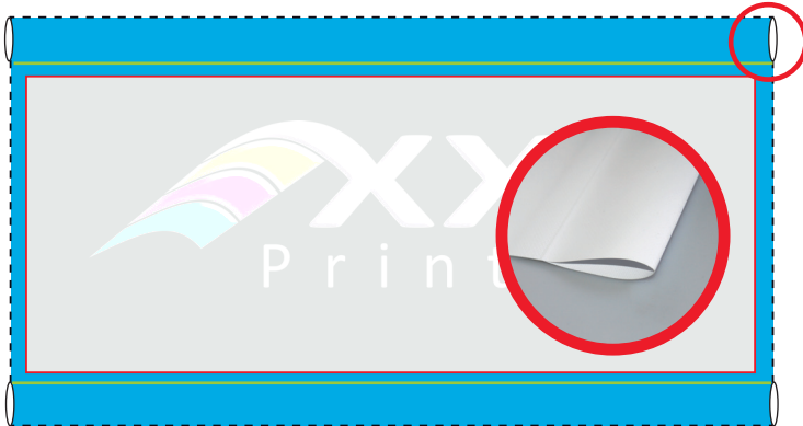
Ausführung mit Hohlsaum oben und unten 10 cm flach (Standard)