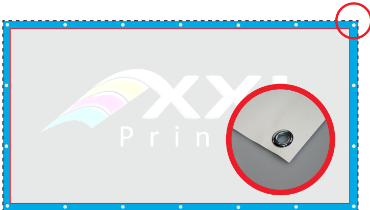
Ausführung mit umlaufendem Saum und Ösen