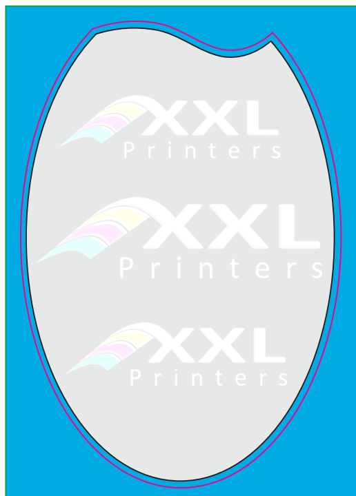
Konturetikett - frei wählbar

es können nur Außenkonturen gestanzt werden